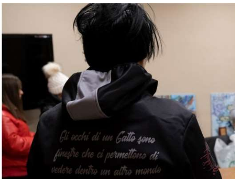
Le 'gattare' di Nichelino ringraziate e premiate dal Comune

Un riconoscimento per le tutor che si occupano delle colonie feline