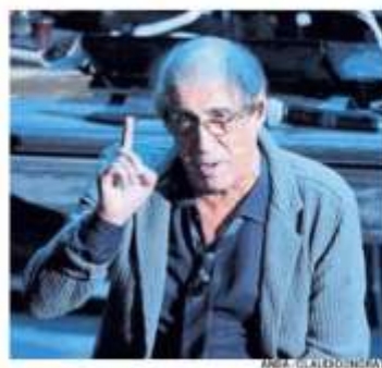
Adriano Celentano torna a via Gluck