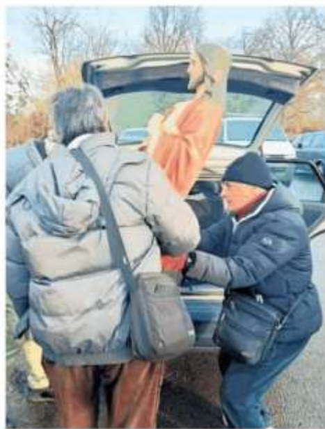
La statua caricata in auto dai volontari dell'associazione

si pone con rispetto e prudenza di fronte a notizie come queste - spiega la Diocesi in un comunicato - Il rispetto è nei confronti della buona fede e della preghiera dei fedeli coinvolti, la prudenza è verso informazioni che, pur trovando immediata e larga diffusione, devono essere verificate attentamente perché potrebbero prestarsi a facili strumentalizzazioni e a operazioni mediatiche che poco o nulla hanno a che fare con la fede e con la vita quotidiana della Chiesa». In una parola: cautela. Quello che è sempre trapelato dopo quanto vissuto dai fedeli l'8 dicembre scorso, durante il pianto della statua. I fedeli insistono che non sarebbe stato nemmeno l'unico, ma almeno in altre tre occasioni avrebbero visto lacrime scendere dagli occhi dell'immagine di Cristo.