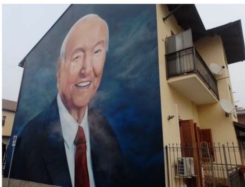
Nichelino, inaugurato il murales dedicato a Piero Angela: "Continua a vivere accanto a noi"

Oggi il grande divulgatore scientifico scomparso ad agosto avrebbe compiuto 94 anni: "Un professore che non saliva mai in cattedra ma parlava un linguaggio comprensibile a tutti"