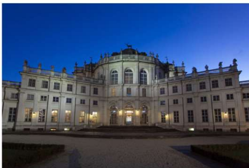
Nichelino al lavoro con Gtt per prolungare la linea 1 fino alla Palazzina di Stupinigi

Un modo per rendere più accessibile, soprattutto ai giovani, l'accesso alla residenza sabauda e incentivare turismo ed economia locale