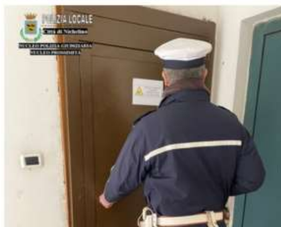
Nichelino, sgomberato alloggio Atc occupato illegalmente

La Polizia locale è intervenuta in via Pracavallo