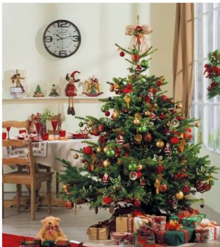
Nichelino "adotta" gli abeti di Natale per realizzare un bosco urbano.

Dal 9 gennaio si potrà portare il proprio albero all'Ufficio Manutenzione che, individuata l'area più adatta, si occuperà di metterlo a dimora