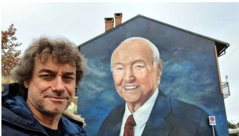
Alberto Angela in visita a Nichelino