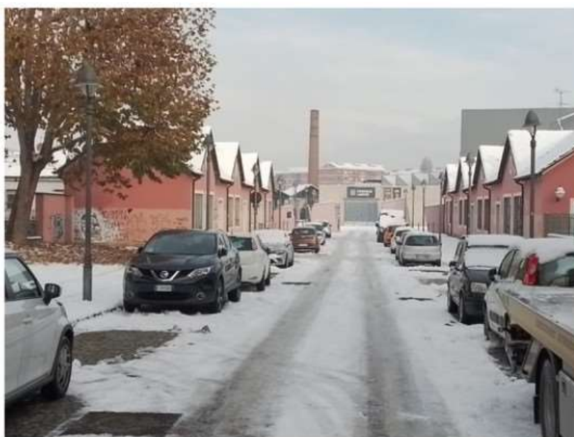
Strade (abbastanza) pulite, ma incubo ghiaccio sui marciapiedi di Moncalieri e Nichelino

Le criticità maggiori in via De Filippo (nei pressi delle Fonderie Limone) e nelle strade laterali a corso Trieste a Moncalieri, mentre sono via Dei Cacciatori e parte di via Torino a creare insidie ai guidatori di Nichelino