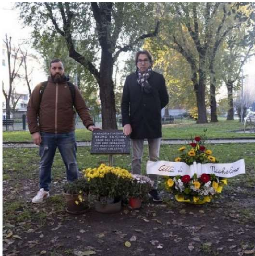
"Non voglio morire!", a Nichelino si ricorda la tragedia della Thyssen