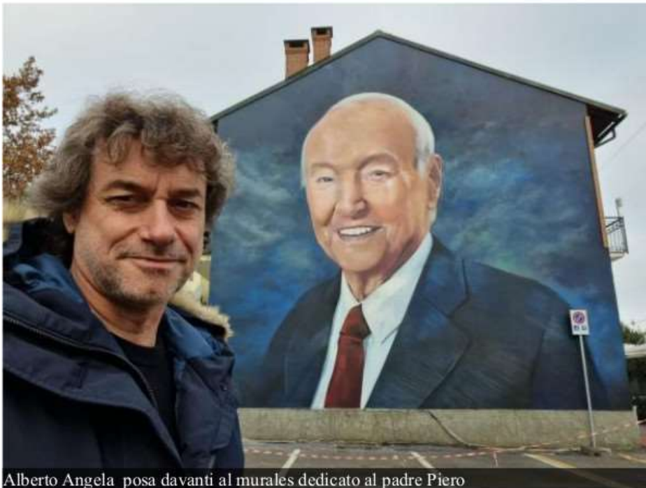
Alberto Angela posa davanti al murales dedicato al padre Piero

«È bellissimo, immenso... grazie di cuore!» è il commento postato sui social dal divulgatore scientifico