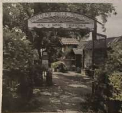
La struttura eretta nel corso degli anni a Stupinigi