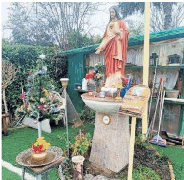
La statua di Gesù nella piazzola del parco di Stupinigi

«Le persone erano raccolte in preghiera per una famiglia in difficoltà - spiegano dall'associazione Luce Dell'Aurora, che da anni si prende cura della zona -, quando a un tratto una donna ci ha avvertito che dagli occhi della statua di Gesù scendevano lacrime. Ci siamo avvicinati, era proprio così. Il nostro appello per questa famiglia bisognosa è stato accolto. Non possia-