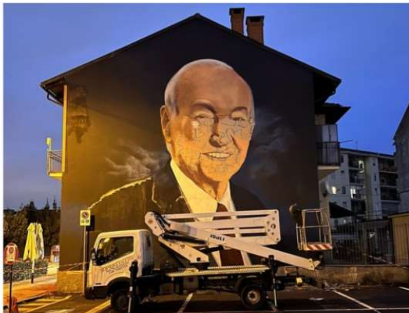
Nichelino, giovedì 22 l'inaugurazione del murales dedicato a Piero Angela

Nel giorno in cui il grande divulgatore scientifico avrebbe compiuto 94 anni