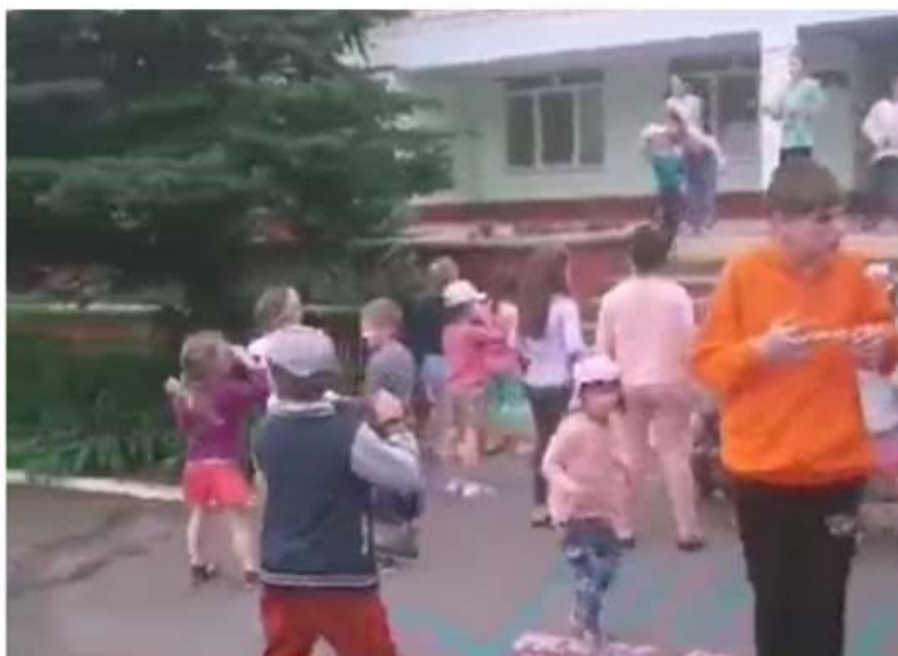
Nichelino, l'associazione San Matteo aiuta i bambini bielorussi di Praleska

Non potendo più ospitare i bambini della città bielorussa, dopo l'inizio della guerra in Ucraina, proposti aiuti per cure e sostentamento