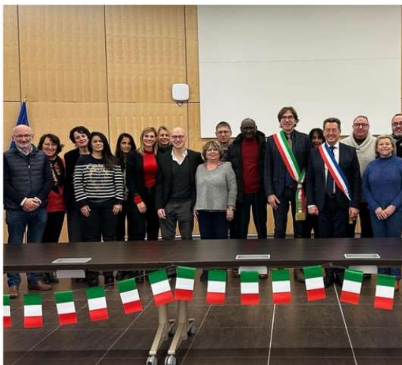
Rafforzato il gemellaggio tra Nichelino e la città francese di Caluire et Cuire