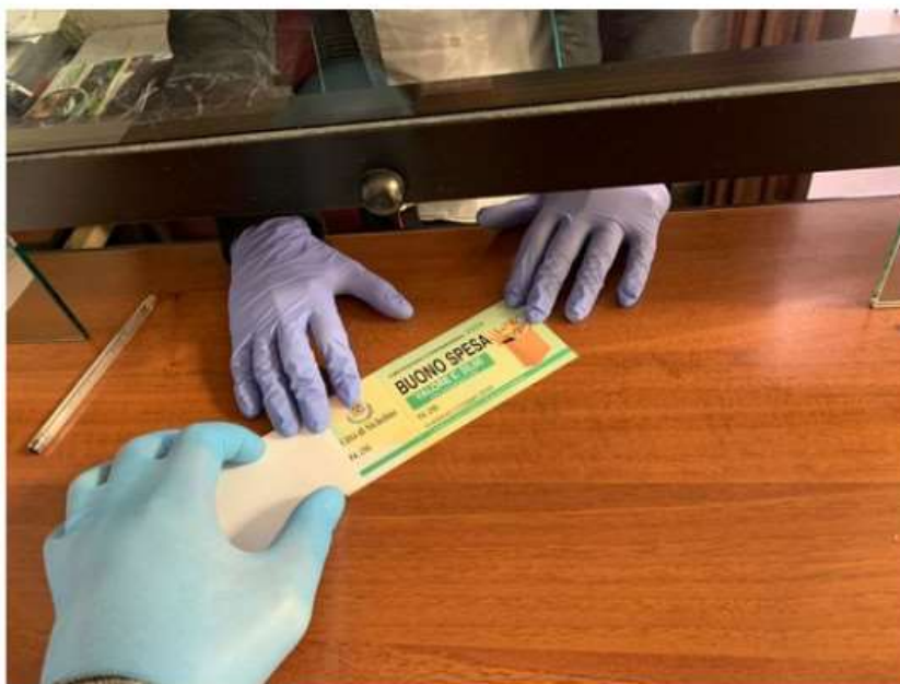
A Nichelino il Comune rilancia i buoni spesa per 740 famiglie in difficoltà

Stanziati 80 mila euro per una misura già utilizzata durante la prima fase della pandemia