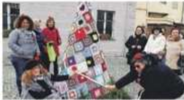
L'albero di Natale del neonato "Filo che Unisce".

CANDIOLO È nato un nuovo gruppo associativo, di signore laboriose che, a colpi di uncinetto e lana, ha già donato alle comunità candioline due opere creative. Autoabbeverato "Il Filo che Unisce", il gruppo ha realizzato il calendario dell'Avvento posto sotto il portico del Vecchio Comune - dove è anche possibile lasciare o prendere dei pensieri natalizi - e l'albero di Natale, ora esposto in piazza II. Sella all'interno della "foresta" sorta per le festività, insieme all'albero del "Filo che Unisce", altri realizzati con materiali naturali e/o di recupero da candiolinesi di qualsiasi età. In una reinterpretazione dei tradi-