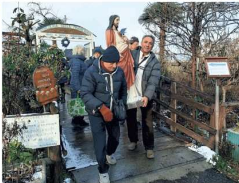
Martedì è stata la stessa associazione Luce dell'aurora a trasportare in auto la statua nella sede torinese della Diocesi