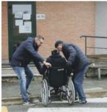
L'ingresso dell'Asl di via Pio V.