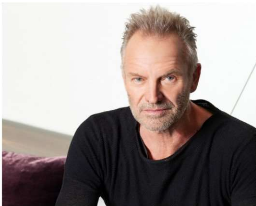
Sting tra i grandi ospiti dell'estate 2023 di Stupinigi Sonic Park

Con lo spettacolo "My Songs" sarà protagonista la sera del 12 luglio