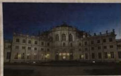
La Palazzina di Caccia di Stupinigi

gio degli Elfi di "Natale è Reale". Proprio per la Notte Bianca, è prevista pertanto l'apertura speciale di tutte le attività della manifestazione natalizia. Tra gli eventi di spicco, l'animazione di Circo con il fuoco e colorati e suggestivi giochi di luce. Babbo Natale inoltre, sarà presente nel suo studio e a disposizione di tutti i bambini, per selfie e la consegna delle letterine, fino alle 22.