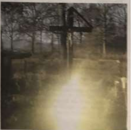
Sopra, le foto di alcune delle strane apparizioni di luci, fuochi e immagini che si sono ripetute nel corso degli anni a Stupinigi