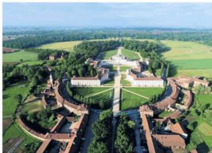
Analoghi problemi nel raggiungere la Palazzina di Stupinigi li hanno Candiolio e Vinovo

A Nichelino si prova a superare il problema con il prolungamento della navetta 1, il dialogo con Gtt è partito da qualche giorno: «Si tratta della circolare interna cittadina con ca-