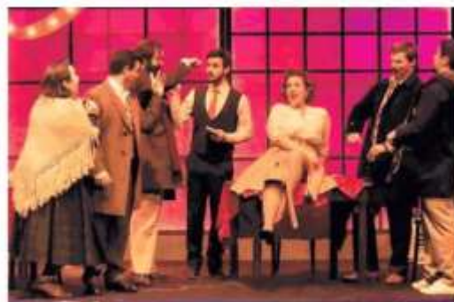
Quella di Bohème sarà una messinscena avvincente e cinematografica che trasforma l'opera in uno spettacolo attuale e contemporaneo