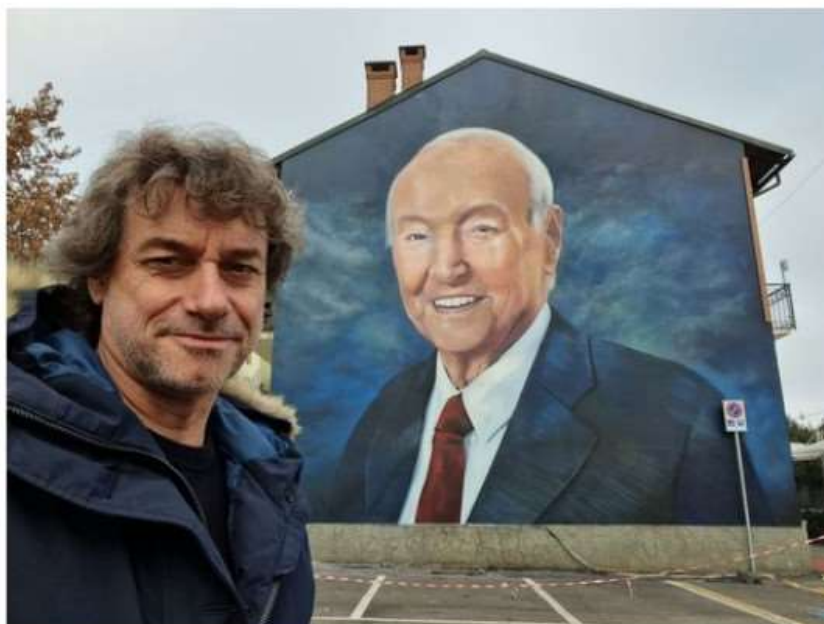
Alberto Angela a Nichelino per ammirare il murales dedicato al papà Piero

Una visita in gran segreto, che però in tempi velocissimi è diventata di pubblico dominio