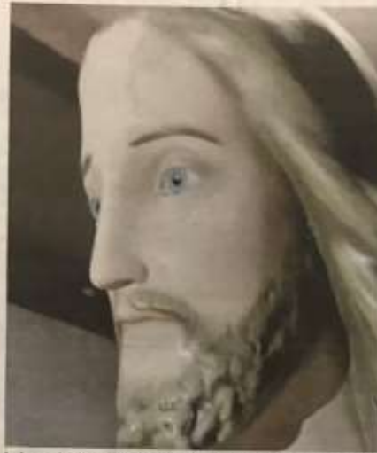
Le immagini di due delle quattro volte in cui la statua avrebbe pianto