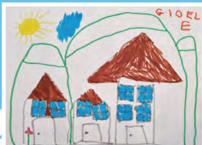
Nichelino e le montagne Gioele Piccoli - 4 anni