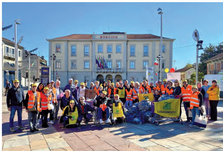
Puliamo il Territorio

#nonseguireilgregge , progetto lanciato a inizio novembre che vede le pecore al pascolo nei prati degli istituti scolastici nichelinesi Erasmo da Rotterdam e Maxwell, oltre a fare manutenzione “green” promuove l’agricoltura locale, il consumo critico, consapevole e a KM0 sostenendo i piccoli agricoltori e contadini locali.