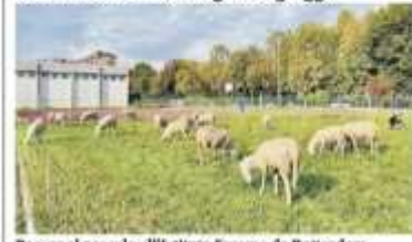
Pecore al pascolo all'Istituto Erasmo da Rotterdam.

Con l'iniziativa "Non seguire il gregge"