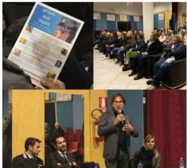
Difendersi dalle truffe: Nichelino organizza secondo incontro per aiutare gli anziani