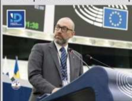
Alessandro Panza, euro-parlamentare del Gruppo Lega - Identità e Democrazia

«Se dovessimo dare un premio all'ipocrisia lo vincerebbe l'Europa a mani basse, basti pensare che una delle parole più abusate da questa Commissione è "Solidarietà" che peraltro vediamo solo nelle dichiarazioni della presidente Ursula von der Leyen, non nei fatti concreti. Più ipocrisia di così». Non una mezza fermata: Alessandro Panza, euro-parlamentare del Gruppo Lega - Identità e Democrazia, nel quotidiano le parole dell'Unione europea.