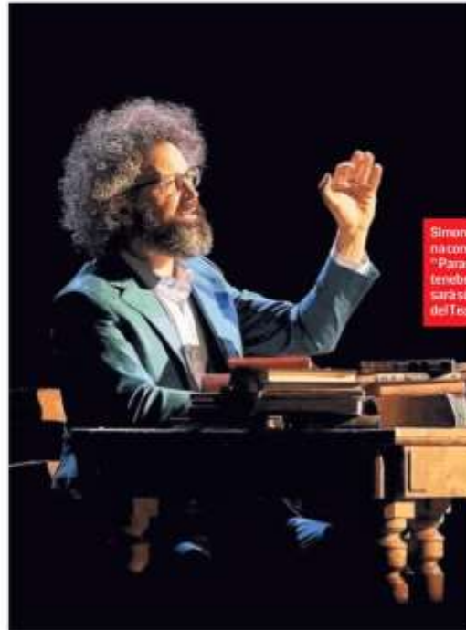
Simone Cristicchi in scena con il suo spettacolo «Paradiso - Dalle tenebre alla luce» che sarà sul palco del Teatro Superga

«Non sono quello di quattro anni fa, a me quarantenne ha cambiato la visione. Durante la quarantena ho rivisto molto della mia vita, mi sono immerso nel silenzio, ho scritto un libro e ho riscoperto il talento del disegno».