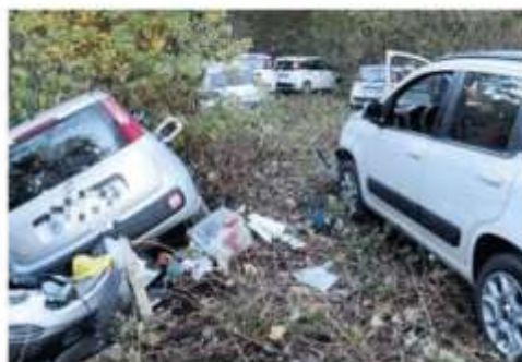
La discarica di auto rubate scoperta dai carabinieri a Rivalta

nieri di Orbassano le hanno individuate durante un controllo del territorio. La terza discarica di macchine nel giro di un mese, dopo le due scovate dalla polizia locale a Nichelino nelle vie della zona industriale al confine con Vinovo, con una decina di auto smontate dopo il furto. L'ipotesi è quella della crescita del mercato nero, con il possibile coinvolgimento di qualche professionista del settore. Trovare i