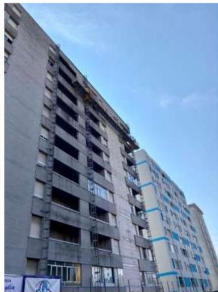
A Nichelino c'è tempo fino al 23 dicembre per richiedere il bonus affitti

Chi ne ha diritto e le modalità per presentare la domanda