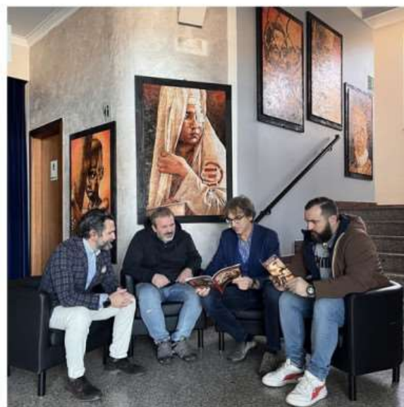
"Matteo 25. Restiamo Umani", inaugurata a Nichelino la mostra di Massimiliano Ungarelli

Il richiamo al Vangelo nelle opere dell'artista nichelinese visibili al Teatro Superga a margine dei 17 spettacoli in calendario della stagione 2022/23