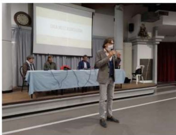
Nichelino lancia il progetto della nuova Casa delle Associazioni

L'idea è ospitarla dove oggi c'è cascina San Quirico ma servono risorse, oltre gli 80 mila euro del Next Generation We. Tolardo: "Progettazione condivisa con la Città". Attivata una mail per ricevere idee e proposte