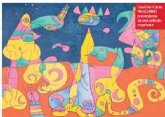
Una Rota di Joan Mirò (1966) proveniente da una collezione privata

A Palazzo Salmatoris sono esposte 52 opere di Mirò, e qualcuna in meno è a Casa Francoforte, ma lui non è l'unico artista nelle due esposizioni. In dialogo ci sono altri maestri come Picasso, Dalí, Fontana, Burri, Gallizio, Niki de Saint Phalle, Hartung, Calder, Vedova, de Chirico, Matta e altri. Per un totale di un centinaio di pezzi a Cherasco, e una settantina a Busca. Le opere di Joan Mirò provengono da collezioni private, quelle di altri artisti da musei come la Gam, «ed è un progetto che ci fa cominciare il maestro indiscusso del