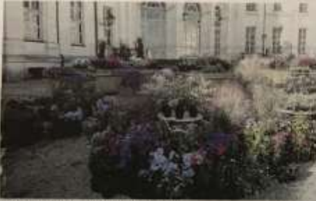
La Palazzina di Caccia di Stupinigi

bose, graminacee, orchidee, rose, bonsai ma anche carnivore, agrumi siciliani e le ambite varietà stagionali, tra cui ciclamini e peperoncini. A impreziosire ulteriormente la proposta florovivaistica di Floreal saranno due giardini tematici temporanei, installati nel Cortile d'Onore e pensati per far vivere ai visitatori delle vere e proprie esperienze alla scoperta del benessere. "Il giardino terapeutico" per l'ansia e la de-