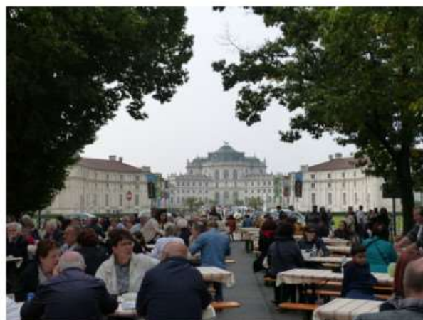
Con la Fiera di Stupinigi si chiude il programma delle celebrazioni di San Matteo

La nona edizione vede la Sardegna come ospite d'onore. Stand, bancarelle e appuntamenti per tutta la giornata