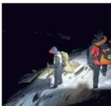
Le operazioni di recupero della salma

Gualdrini, originario di Bologna ma da tempo residente a Milano, dove si era laureato e lavorava, era partito in solitaria di buon'ora, domenica, dalla frazione Campiglia di Valgrato Soana. Aveva superato il pian dell'Azaria, dedicato a Mario Rigoni Stern, e aveva proseguito verso la Torre di Lavina, una delle ultime vette in una vallata incontaminata nel cuore del Parco