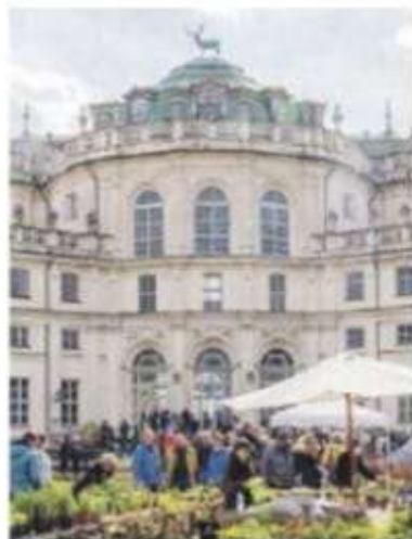
Floreal, l'anteprima di aprile 2022.

Alla sua seconda edizione, il festival - che vede la collaborazione di Fondazione Ordine Mauriziano, Associazione Stupinigi è, Parco Nazionale del Gran Paradiso, Associazione Gomboc e Festival Teatro a pedali e il contributo di Fondazione CRT - ospiterà la mostra mercato con i migliori florovivaisti provenienti da tutta Italia e qualche ospite da fuori confine, la realizzazione di due giardini temporanei tematici, un ricco palinsesto culturale e un insieme di laboratori FLOR Edu pensati per i più piccoli; il tutto