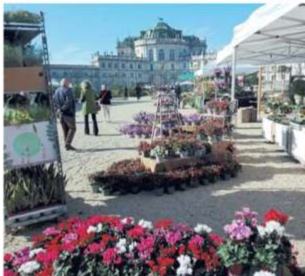
Ballato e Rossella Vayr e de "I racconti delle piante" di Fabio Morziano. Il programma completo è consultabile su www.orticolapiemonte.it . Orari: dalle 9.30 alle 19.30. Biglietto: 7 euro, gratuito fino a 14 anni. —

Tra gli appuntamenti, da non perdere l'incontro con Gianluca Piovesan, "cacciatore" di alberi vetusti; il laboratorio olfattivo dell'Accademia Europea delle Essenze-Muses; la piattaforma Must Had, che promuove l'arte del refashion; il progetto LifeOrchids per la salvaguardia delle orchidee selvatiche e la presentazione della "Guida ai Vivai d'Italia" di Giustino