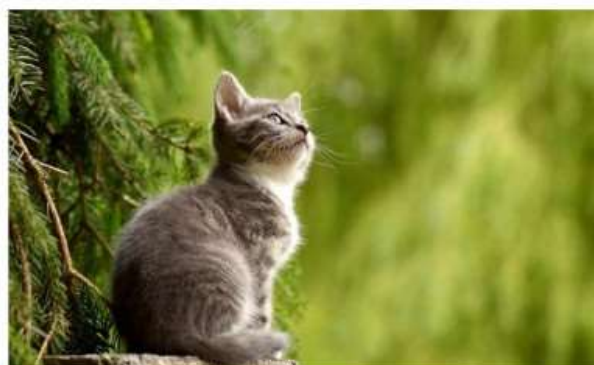
A Nichelino al via la seconda campagna di microchippatura gratuita