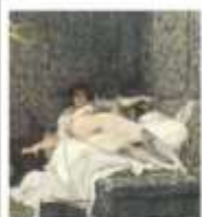
«La femme de Claude»