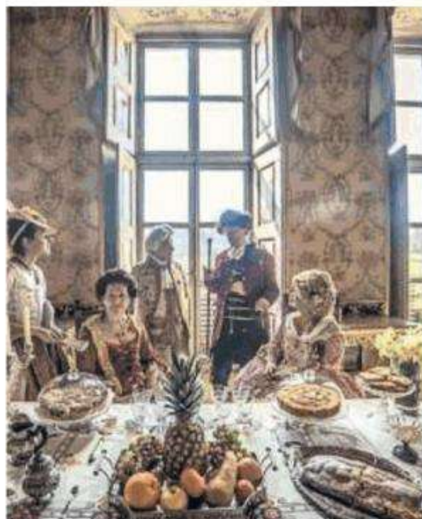
Un momento di "Prima che arrivi il sovrano"