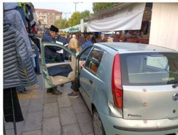
A Nichelino pensionato sbaglia strada e finisce tra la folla del mercato