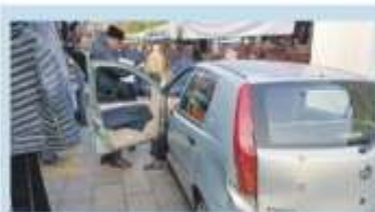
Nichelino Auto tra la folla

NICHELINO 130' antica cascina da recuperare e tutt'intorno una nuova area verde in cui proporre iniziative ed eventi per la collettività. «Prima di prendere decisioni vogliamo ascoltare le istanze dei cittadini e delle stesse associazioni», precisano dall'Amministrazione al lancio del progetto della Casa delle Associazioni. Un luogo che dovrebbe mettere insieme il social housing e il volontariato ludico: sorgerà la Cascina San Quirico, il cui nucleo originario risale addirittura al 1200. Un'area che ha rappresentato, grazie a un'importante dritta di benagione, per secoli uno dei centri nevralgici dell'economia cittadina. La presentazione pubblica dei progetti - che conta già su una prima quota di finanziamento per 10 mila euro, ottenuti dalla Compa-