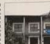
logia della Salute e Comunità.

NICHIELINO - Ha preso il via lunedì alla Biblioteca Civica Arpino con il primo appuntamento dedicato al «matrimonio» tra scuola e digitale. L'edizione 2022 del Festival dell'Innovazione e della Scienza dedicato al "Digitale", uno dei temi più dibattuti da scienziati e umanisti per i cambiamenti che ha portato nelle nostre vite, dagli ambienti di lavoro alle relazioni sociali. Il calendario dell'iniziativa prevede in questa settimana altri tre appuntamenti altrettanto interessanti. Quest'oggi, mercoledì 12 ottobre, si parlerà di "Digitale" domandando quali riflessi ha l'era digitale sulla complessità dei sistemi sociali umani e del diritto? L'era della digitalizzazione dei processi produttivi, comunicativi e sociali e i numerosi interrogativi che porta non si.