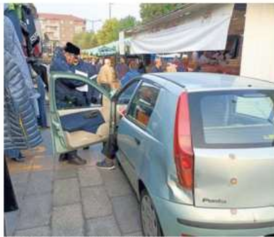
L'utilitaria fermata dagli agenti di polizia locale in via Primo Maggio

La macchina non viaggiava a velocità sostenuta, ma la mezzo al mercato principale di una città da 45 mila abitanti, di sabato mattina, poteva davvero provocare grossi guai. Anche perché oltre ad anziani intenti a fare la spesa ci sono mamme con bambini che corrono e spesso scappano al controllo dei genitori. Dinamiche normali in una zona pedonale e riservata. Secondo le ricostruzioni, il 75 enne è arrivato dalla rotonda che collega via Primo Mag-