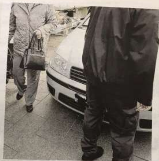
L'auto dell'anziano fermata dai vigili tra i banchi del mercato. Il conducente, apparso in stato confusionale, ha dichiarato di non essersi reso conto di quanto stava facendo. E' stato fermato e multato dalla Municipale

È piombato con la sua auto tra i banchi del mercato, incurante della folla che aveva intorno a sé, e solo per un miracolo nessuno si è fatto male. Si sono vissuti attimi di panico ieri mattina, a Nichelino, quando un pensionato a bordo della sua utilitaria ha pensato bene di farsi largo in piazza 1° Maggio mentre si stava svolgendo il mercato rionale del sabato, il più affollato della cittadina. Un gesto di follia che solo grazie alla prontezza degli agenti della polizia locale non si è trasformato in una potenziale tragedia. Il fatto è accaduto nelle prime ore della mattinata, quando la piazza e le vie limitrofe sono particolarmente affollate dai clienti che si recano a far la