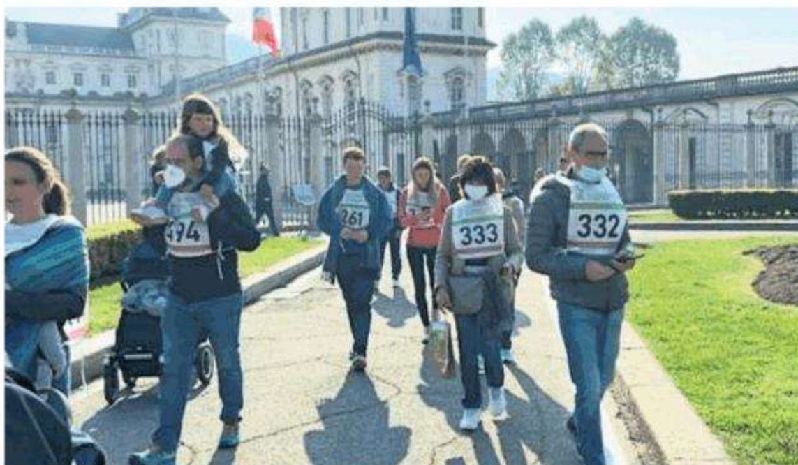
Partenza e arrivo previsti al Castello del Valentino