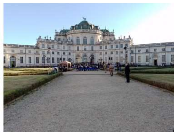
Nasce il Distretto del Commercio di Stupinigi, sarà finanziato con 50 mila euro dalla Regione