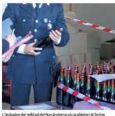
L'indagine dei militari del Nas insieme ai carabinieri di Torino

aver voluto frodare alcuni negozi della zona mettendole in vendita di qualità, quando invece si trattava di prodotti scadenti. Nel blitz dei militari sono state trovate decine di etichette su cui erano scritti nomi di noti vini e indicazioni sull'origine e la composizione, in modo da far passare per marchi pregiati quei prodotti imbevibili a costi sostanzialmente nulli. Di conseguenza