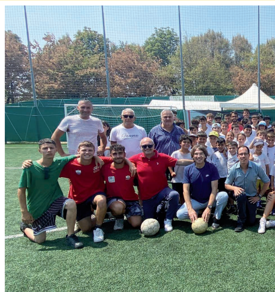
A.S.D. Onnisport Club 19