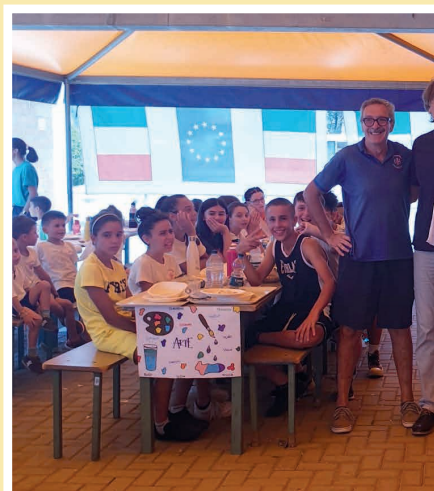
A.S.D. Nichelino H