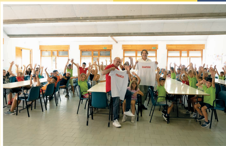
Associazione ricreativa culturale sportiva "Gli Amici del Don Bosco"