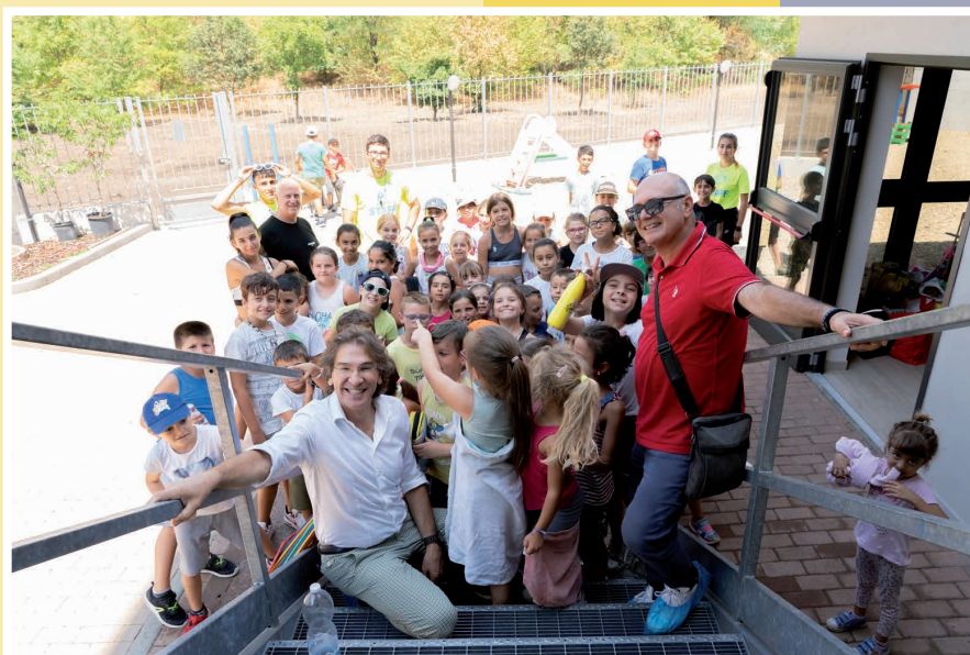
S.S.D. Akuadro Sport