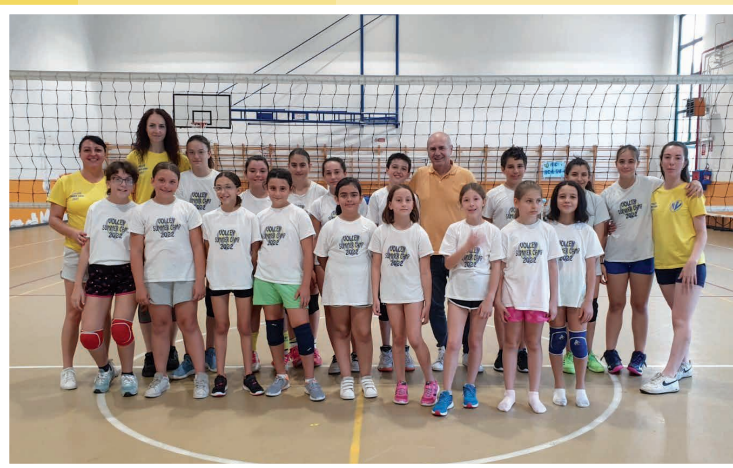
A.S.D. Nichelino Volley