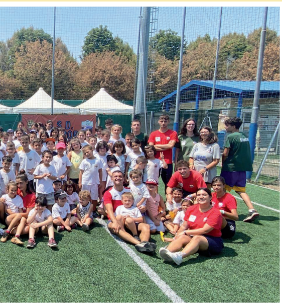
29 e A.S.D. G.S. Sangone

e le parrocchie della Città hanno ospitato moltissimi giovani nichelinesi attivando i Centri Estivi che si sono chiusi a inizio settembre.