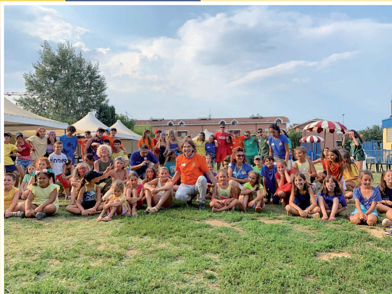
S.C.S.D. Centro Nuoto Nichelino

Quest'estate a Nichelino lo sport non è andato in vacanza, al contrario! A partire dal 13 giugno i complessi sportivi, le palestre scolastiche e private