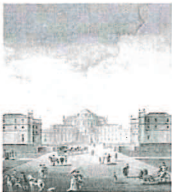
I. Sclopis del Borgo (particolare) "Veduta di Stupinigi dal lato di Torino", 1783.