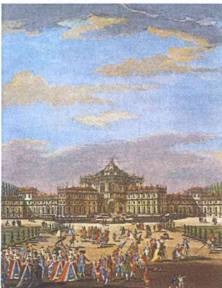
I. Sclopis del Borgo (particolare) "Veduta di Stupinigi dal lato del Giardino", 1783.

Dalla Residenza Comunale, 4 settembre 2013