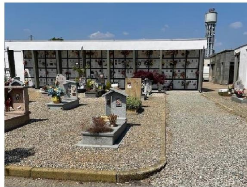
Il Comune rimette a nuovo il cimitero di Nichelino e quello di Stupinigi

Tolta l'erba dai camminamenti, via al diserbamento in mezzo alle tombe: non si vuole ripetere quanto avvenuto nell'estate del 2021