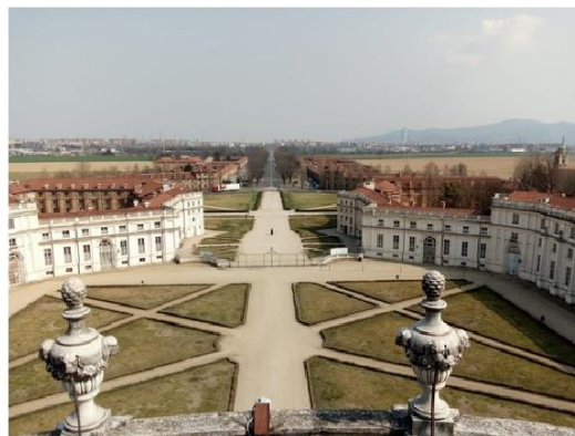
Per i 200 anni dell'Arma dei Carabinieri a Nichelino concerto alla Palazzina di Stupinigi

La fanfara del 3° Reggimento si esibirà sabato 11, preceduta da una mostra di cimeli e d'auto d'epoca