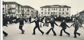
Piazza Di Vittorio in una foto degli anni '70.