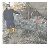
Sul greto del Sangone.

NICHELINO Le divise gialle e blu della Protezione Civile sono tra le cose belle di questi due ultimi complicatissimi anni. Molti dei servizi legati all'emergenza sanitaria non si sarebbero potuti infatti realizzare senza il supporto dei tanti volontari del gruppo comunale. A poco più di vent'anni dalla nascita - il primo nucleo è del 2000 - il gruppo di Nichelino si è più volte ritrovato a gestire momenti difficili: un impegno prolungato e continuativo, che nessuno aveva davvero preventivato. «Non è sempre bello quello cui assistiamo dove si fanno tamponi o vaccini, per