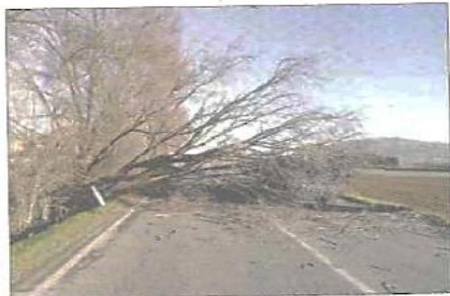
La parete crollata di un capannone in via Bardonecchia, a Nichelino. Un albero abbattuto dalle raffiche a Tetti Piatti

del fuoco, carabinieri e polizia locale hanno subito chiuso la strada e messo in atto la rimozione delle macerie, nonché le operazioni necessarie a rimettere in sicurezza l'area. A Tetti Piatti di Moncalieri invece per qualche ora è stata interdetta alle auto la provinciale «20», dove un grosso albero si è coricato sulle carreggiate. Stessa cosa sul tratto tra Carignano e Carmagnolasè