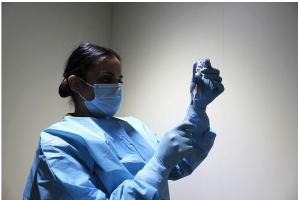
Omicron corre, dal 10 gennaio nuovo hub vaccinale a Nichelino

Sarà ospitato dalla sezione locale della Croce Rossa, con ingresso da via Nazario Sauro