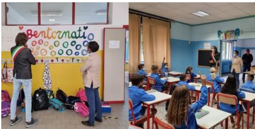
A Nichelino nuovo servizio di ristorazione scolastica: più spazio agli alimenti bio

Sarà gradualmente eliminata la plastica dei prodotti monouso