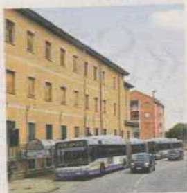
Il capolinea della linea 14