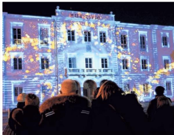
La videoproiezione sulla facciata del Municipio di Nichelino, costate 60 mila euro

Il tema del portavoce era stato già affrontato in uno degli ultimi Consigli comunali, dove l'opposizione aveva chiesto lumi. Le voci giravano da gior-