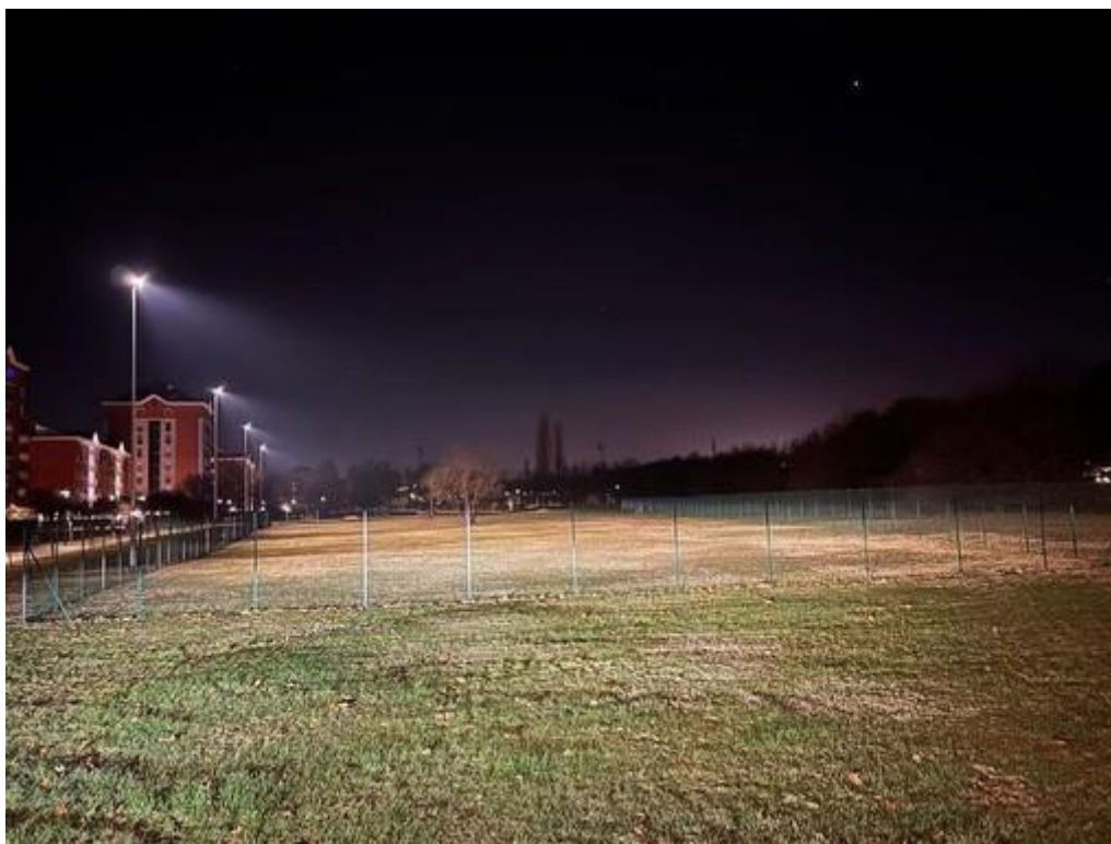
A Nichelino aree cani utilizzabili anche in orario notturno

Grazie al piano luce, con l'illuminazione installata nei giorni scorso l'area di via Nenni è a disposizione degli amici a quattro zampe anche di sera