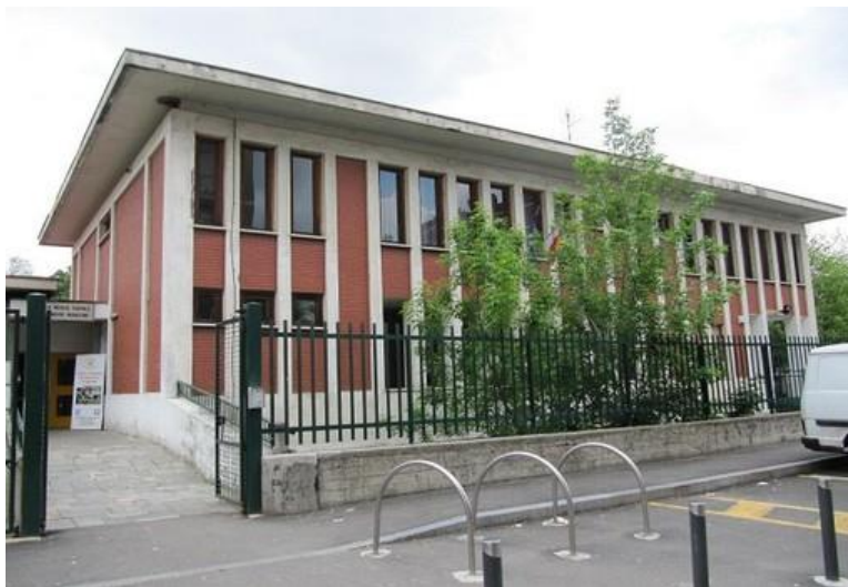
Problemi agli impianti di riscaldamento, chiuse due scuole a Moncalieri e altrettante a Nichelino

Un problema alla caldaia ha lasciato al freddo Barruero e Menini a Moncalieri, la rottura di una tubazione ha portato alla chiusura di De Amicis e Manzoni a Nichelino