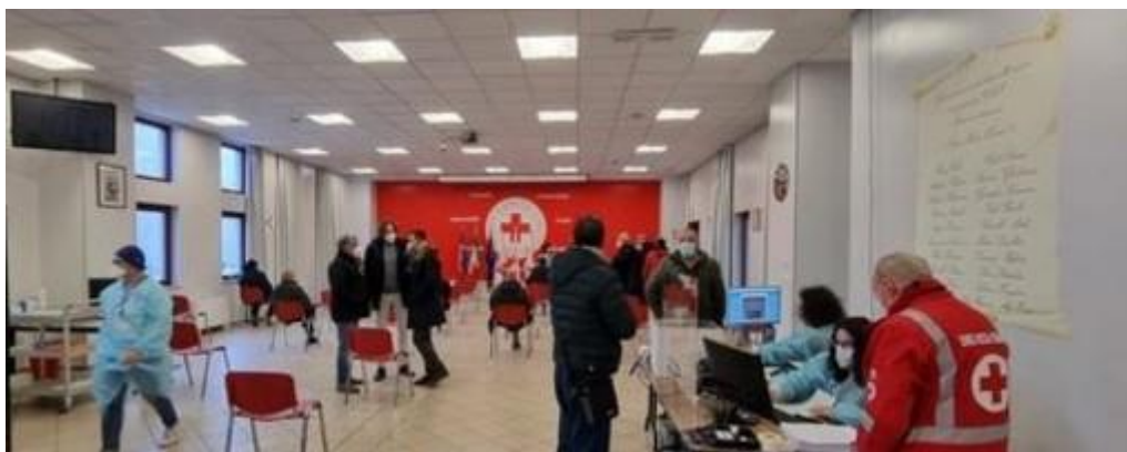
Coronavirus, inaugurato il nuovo punto vaccinale a Nichelino

In via Nazario Sauro, sede della Croce Rossa locale. Il sindaco (e medico) Tolardo: "Un luogo dedicato per chi deve fare la terza dose"