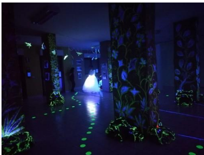
Nichelino, inaugurato il nuovo anno della ludoteca comunale

Proposte e attività de “La Bottega dei Sogni”, lo spazio dedicato alla cultura ludica. Al via il nuovo servizio di mensa scolastica negli istituti della città