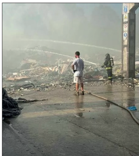
Incendio di uno deposito di stoccaggio rifiuti di Mappano (TO) Evento del 20.06.2020

Nel deposito sta bruciando un grosso quantitativo materiale plastico stoccato per il riciclo e i Vigili del Fuoco , vedendo che la colonna di fumo tende a dirigersi verso le abitazioni ricomprese negli isolati tra via Cacciatori e via Pracavallo, decidono di chiamare l'ARPA Piemonte e l'ASL per effettuare un monitoraggio dell'aria, verificare l'eventuale sviluppo di diossina prodotta dalla combustione degli imballaggi in plastica e gli eventuali effetti dal punto di vista del rischio sanitario.