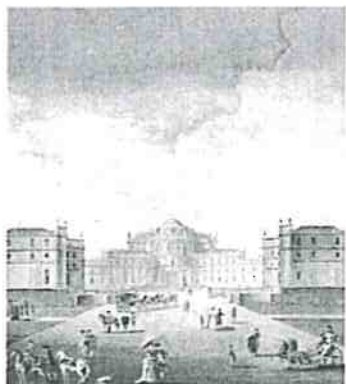
I. Sclopis del Borgo (particolare) "Veduta di Stupinigi dal lato di Torino", 1783.