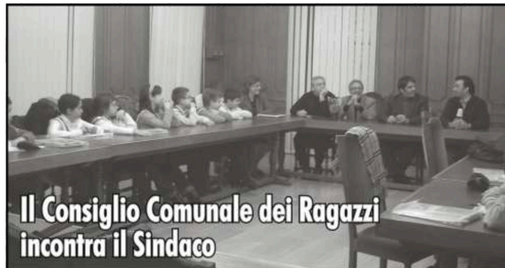
Il Consiglio Comunale dei Ragazzi incontra il Sindaco

Il 4 Febbraio il Consiglio Comunale dei Ragazzi ha incontrato una rappresentanza del Consiglio Comunale. Durante l'incontro il Sindaco ha presentato gli Assessori, spiegando le varie competenze.