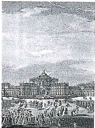
Scalpis del Borgo (particolare) "Veduta di Stupinigi dal lato del Giardino", 1783.

Piazza G. Di Vittorio, 1 - 10042 Nichelino (TO) Tel. 011/6819.1 - Fax 011/6819.572 E-mail: sindaco@comune.nichelino.to.it P. Iva 01131720011